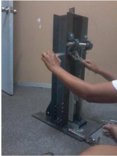
Gambar3. Proses pembuatan alat uji impak charpy untuk material plastik