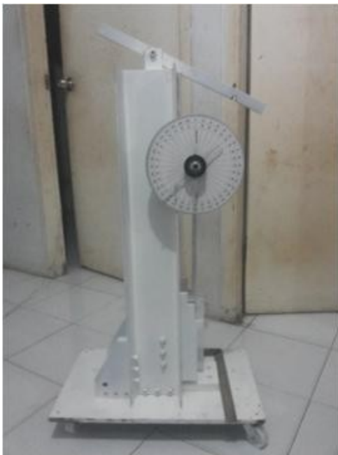
Gambar4. Alat uji impak charpy untuk material plastik