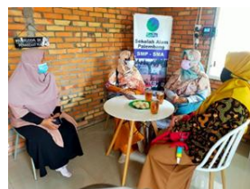
Foto 1. FGD Bersama orang guru

Berdasarkan hasil pelaksanaan kegiatan pengabdian, diketahui bahwa telah terjadi peningkatan pemahaman orang tua dalam hal pengasuhan positif, komunikasi efektif dan penegakkan aturan. Selanjutnya disampaikan foto kegiatan pengabdian, mulai tahap persiapan hingga evaluasi.