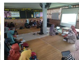
Foto 2. Bersama tua siswa