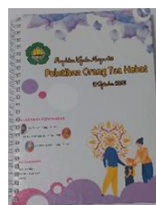
Foto 3. Materi Pengabdian