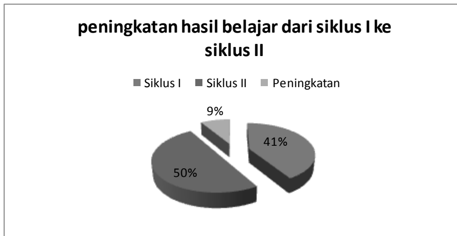
Gambar 1. Persentase Peningkatan Hasil Belajar Dari Siklus I Ke Siklus II

Berdasarkan tabel di atas, nilai rata-rata hasil belajar peserta didik ranah kognitif, afektif dan psikomotor dari siklus I ke siklus II mengalami peningkatan. Nilai rata-rata hasil belajar ranah kognitif peserta didik pada siklus I adalah 6,8 meningkat menjadi 8,2 pada siklus II. Nilai rata-rata hasil belajar ranah afektif peserta didik pada siklus I yaitu 6,6 meningkat menjadi 7,9 pada siklus II. Begitu pula dengan nilai rata-rata hasil belajar peserta didik untuk ranah psikomotor pada siklus I yang memperoleh nilai rata-rata 6,6 meningkat pada siklus II menjadi 8,1.