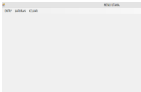
Gambar 3.3 Menu Utama Sistem Penunjang Keputusan Seleksi Mutasi Karyawan PT. bina sakato jaya kiliran jao

Menu utama pada seleksi mutasi karyawan menu entri data calon, menu laporan data calon, dan menu keluar. Fungsi menu entri data calon yaitu menginputkan data-data calon mutasi baru ke dalam database . Pada menu laporan proses seleksi data terdapat form entry data karyawan dan entry penilaian. Pada form laporan yaitu laporan data karyawan dan laporan hasil tes akhir. Untuk lebih jelasnya dapat dilihat pada gambar 3.3.