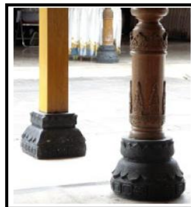
Gambar 5. Aplikasi pondasi umpak pada bangunan Jawa [17].