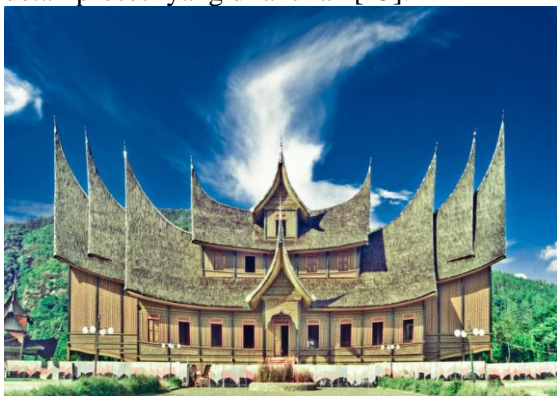
Gambar 3. Rumah Gadang di Minangkabau [14].

Rumah Gadang merupakan salah satu ekspresi arsitektur vernakular Minangkabau yang mampu mencerminkan kebijakan penggunaan bahasa arsitektural masyarakat Minangkabau. Secara garis besar proses pembangunan rumah gadang pada setiap daerah di Minangkabau adalah sama, yaitu tahap perencanaan, pencarian bahan, dan pembangunan. Perbedaannya dengan pembangunan bangunan umum lainnya terlihat pada istilah-istilah teknis yang digunakan dalam rangkaian proses pembangunan dan detail prosesi yang dilakukan [13].