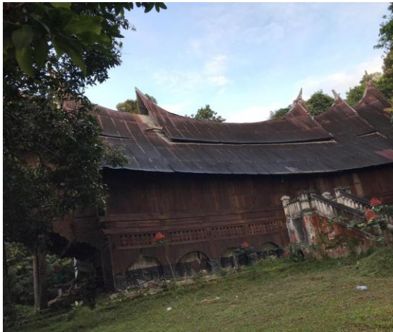
Gambar 6. Salah satu Rumah Gadang milik warga di Sumpur, Tanah datar, 2019 [18].