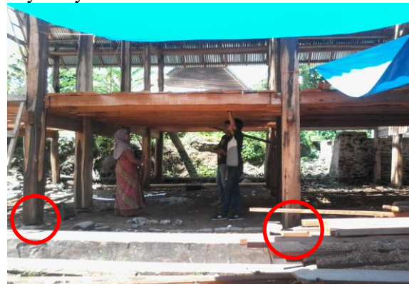
Gambar 4. Pondasi umpak (dilingkari merah) pada Rumah Gadang [16].

Rumah gadang merupakan rumah tradisional masyarakat Minangkabau dengan bentuk panggung dimana pondasi rumah tidak ditanam dalam tanah tetapi diekspos pada permukaan tanah dengan cara menumpukan tiang kolom pada sebuah batu atau yang disebut pondasi umpak. Jarak lantai rumah dengan lantai luar sekitar 1-2 meter sehingga diperlukan tangga sebagai akses masuk rumah. Kolong pada rumah biasanya digunakan sebagai tempat hewan ternak, tetapi kebanyakan kolong dari rumah gadang digunakan sebagai gudang luar untuk menyimpan peralatan bercocok tanam ataupun kayu-kayu bakar.