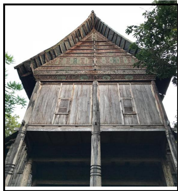
Gambar 5. Rumah Gadang yang menunjukkan pondasi umpak yang utuh di Sumpur, Tanah Datar, 2019 [18].

membuat rumah ini elastis dan fleksibel terhadap pengaruh gempa bumi [9].